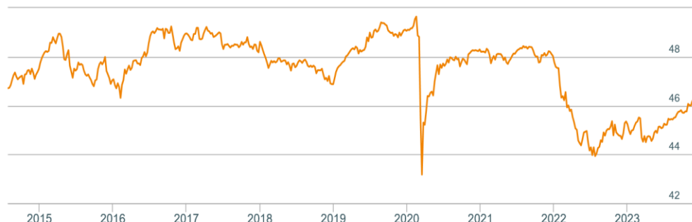
CHART - VR-PrimaMix Rentenstrategie | Investmentfonds | 28.07.2014 - 31.12.2023